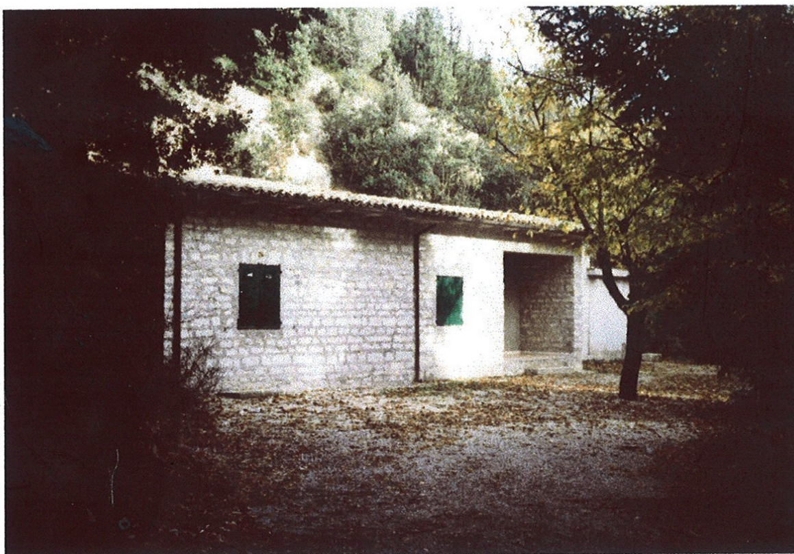
Unità Edilizia n.MC5A.09-RIFUGIO DEL FURLO